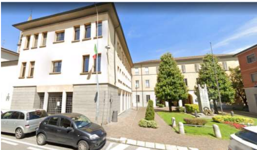
Municipio di Gessate

Al fine di garantire il rispetto delle distanze interpersonali di sicurezza prima e durante le prove e assicurare un flusso ordinato di ingresso ed uscita dei candidati, è stata individuata quale sede di svolgimento delle prove concorsuali orali l'aula consiliare del Comune di Gessate, in Via Badia n. 57 a Gessate, accanto al municipio.