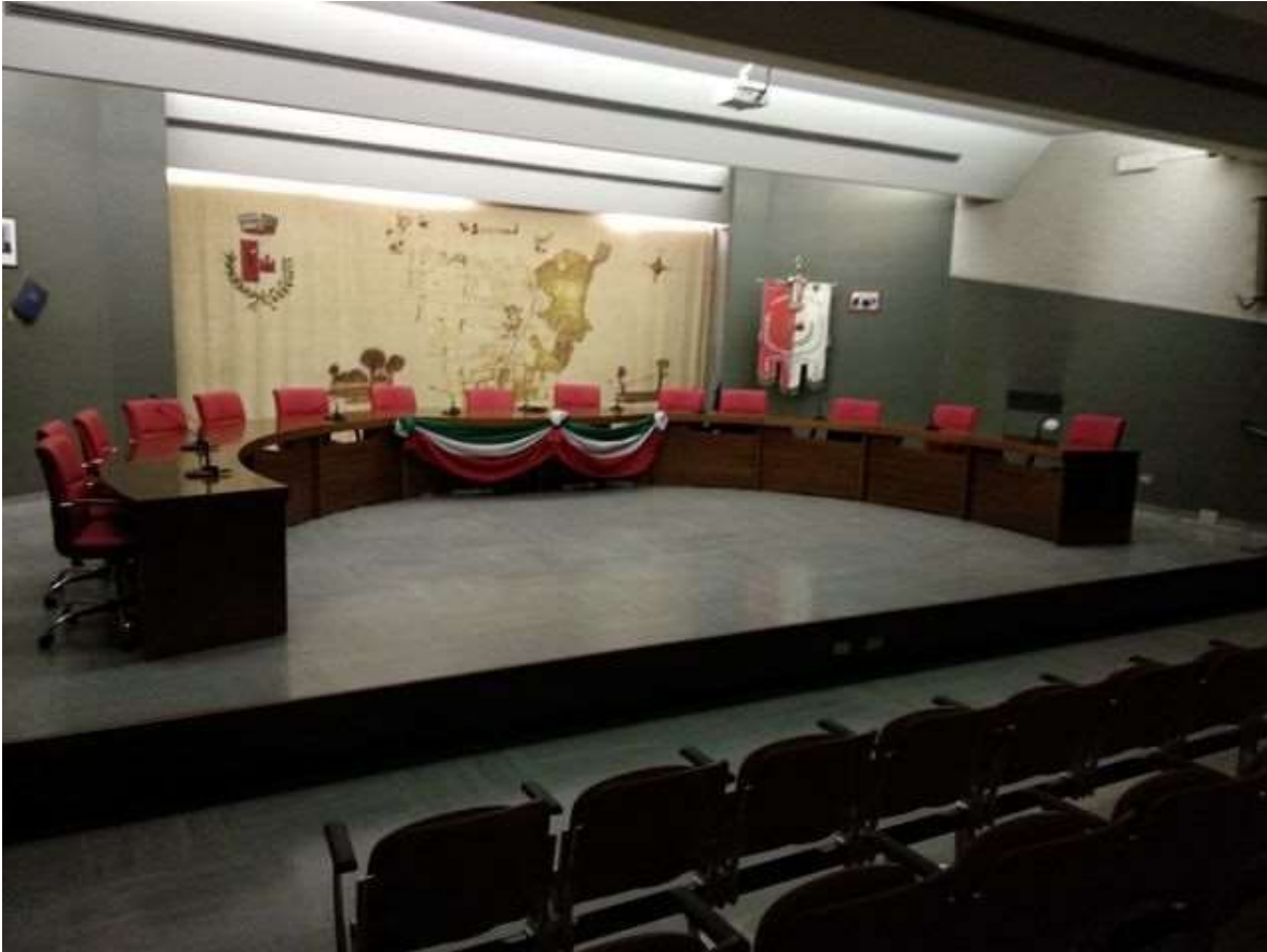
Aula consiliare del Comune di Gessate

Le aree interessate sono chiaramente evidenziate nella planimetria di cui all'allegato 2 al presente documento.